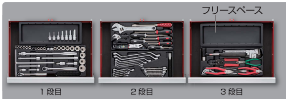
■トレーでの引出し収納例