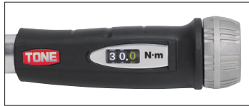
デジタル表示部分